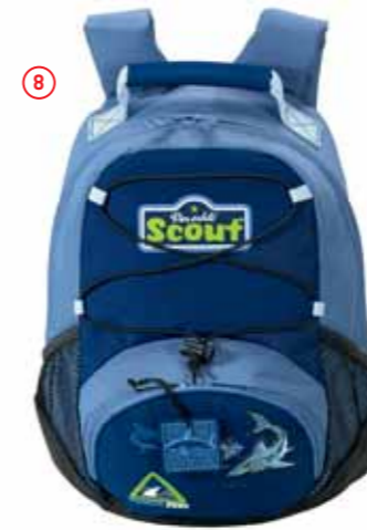
Rucksack VI, Art.-Nr. 2533-00.

Diese Zubehörteile sind separat erhältlich: