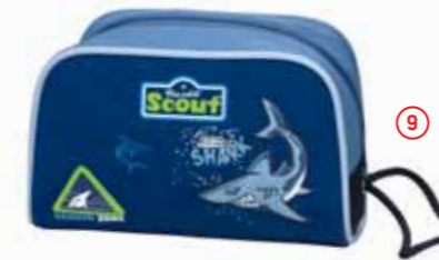
Kulturbeutel, Art.-Nr. 2536-00.