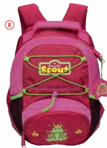
Rucksack VI, Art.-Nr. 2533-00.

Diese Zubehörteile sind separat erhältlich: