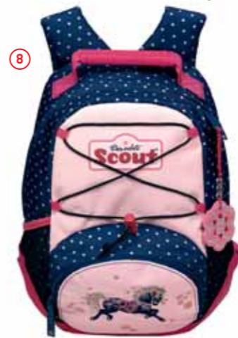
Rucksack VI, Art.-Nr. 2533-00.

Diese Zubehörteile sind separat erhältlich: