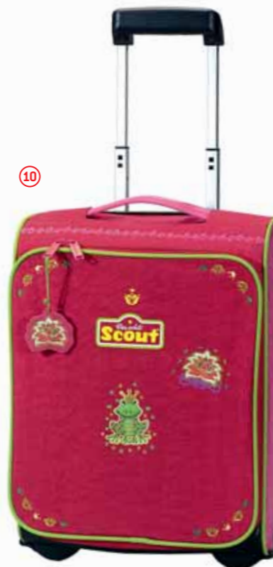
Kinderrolley II, Art.-Nr. 2551-00.