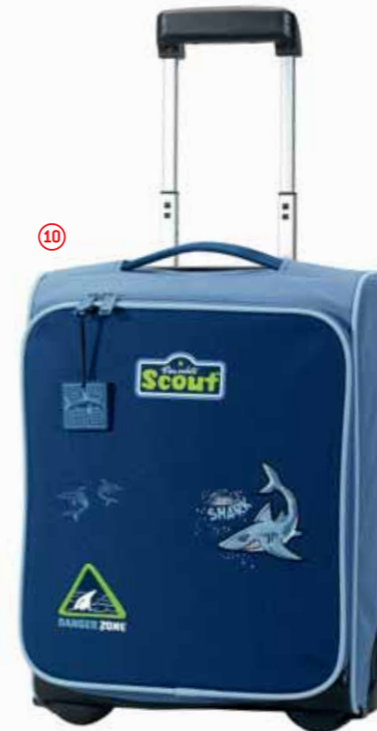
Kinderrolley II, Art.-Nr. 2551-00.