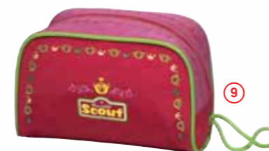
Kulturbbeutel, Art.-Nr. 2536-00.