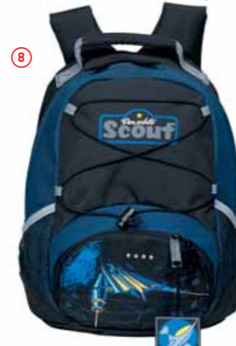
Rucksack VI, Art.-Nr. 2533-00.

Diese Zubehörteile sind separat erhältlich: