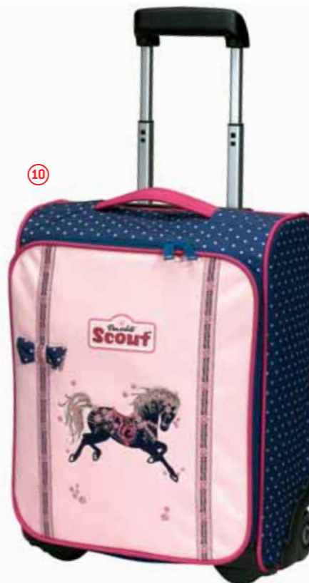
Kindertrolley II, Art.-Nr. 2551-00.