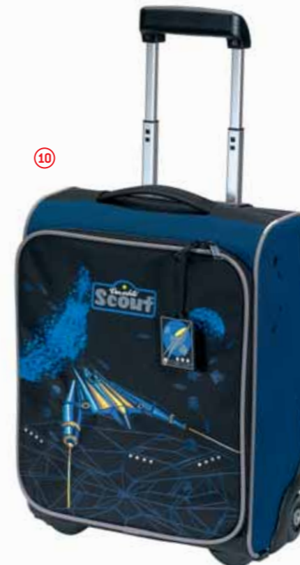
Kinderrolley II, Art.-Nr. 2551-00.