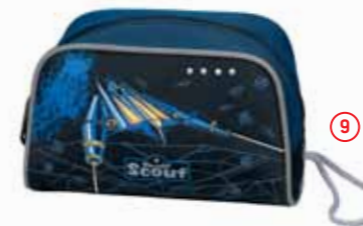
Kulturbeutel, Art.-Nr. 2536-00.