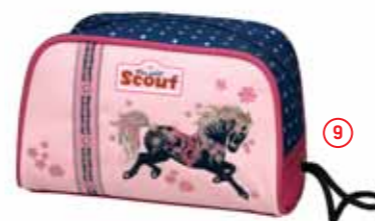
Kulturbeutel, Art.-Nr. 2536-00.